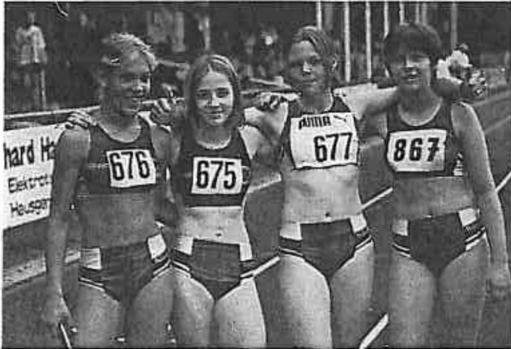
Mannschaft Schülerinnen A von der LG Papenburg-Aschendorf