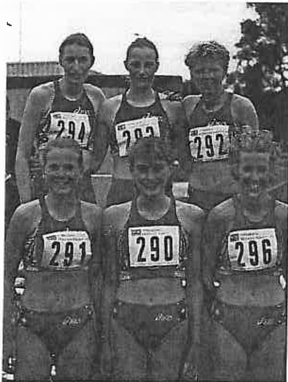
Mannschaft des VfL Lingen Schülerinnen A